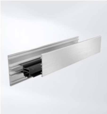
Posuvné spojení pro snížení bimetalického efektu Split insulating bar to reduce the bi-metallic effect