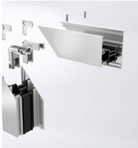
Varianta šroubovatelné rohové spojky Screw-type corner cleats are an option